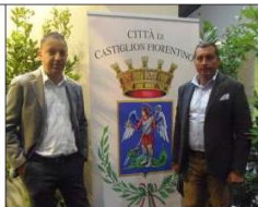
Un impegno concreto sarà quello di realizzare percorsi che colleghino il sentiero della Chiana con il centro storico e la val di chio". La presenza ad AgrieTour dei due Comuni della Valdichiana è quindi "naturale".