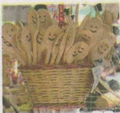
Oggi si chiude la rassegna