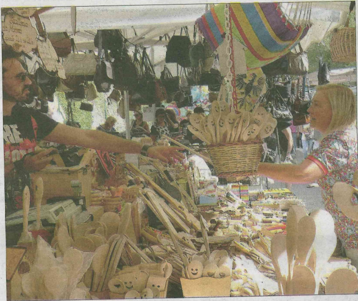
Giornata di chiusura Numeri da record per quanto riguarda l'affluenza di visitatori